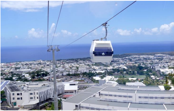
Document 4 – Photographie du téléphérique Papang

Le premier téléphérique à La Réunion a été inauguré le 15 mars 2022. Baptisé "Papang", il pourra accueillir jusqu'à 6.000 passagers quotidiens entre 6h et 20h.