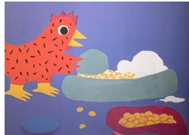
MOUDRE LES GRAINS