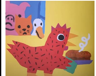
MANGER LE PAIN