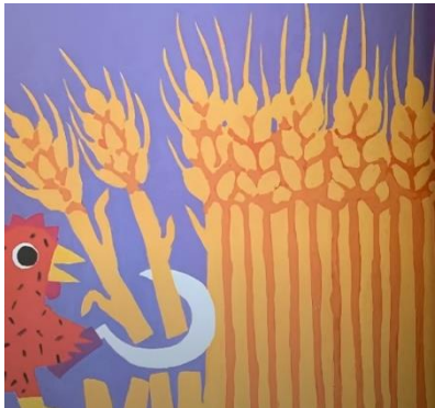
FAUCHER LE BLE