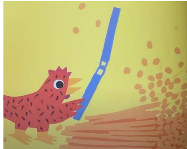
BATTRE LE BLE