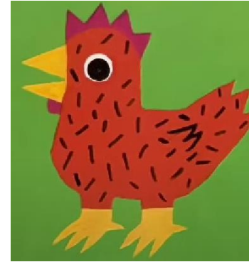
LE PETITE POULE ROUSSE