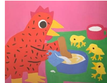
FAIRE DU PAIN