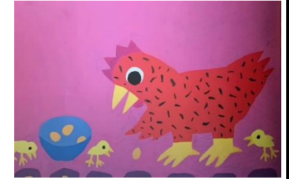
PLANTER LES GRAINES