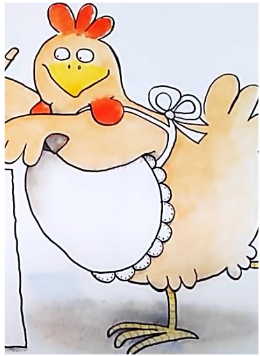
LE TABLIER le tablier le tablier