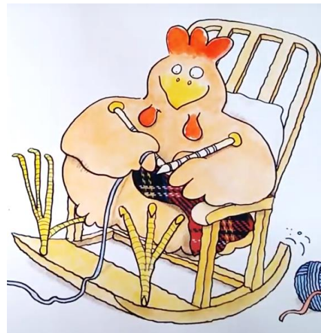
UNE CHAISE A BASCULE une chaise à bascule une chaise à bascule