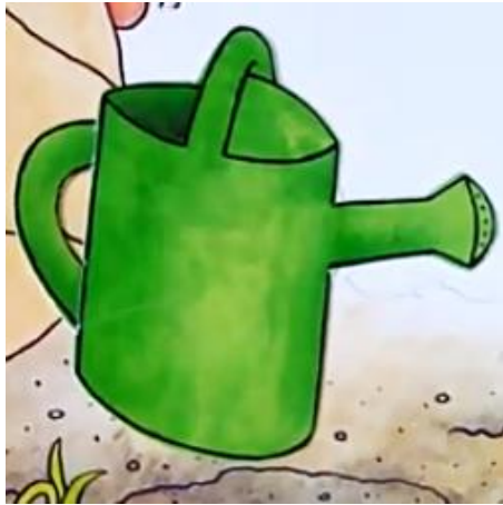
UN ARROSOIR un arrosoir un arrosoir