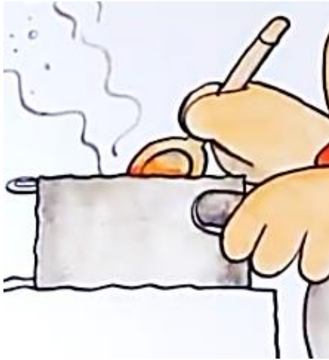
LA MARMITE la marmite la marmite