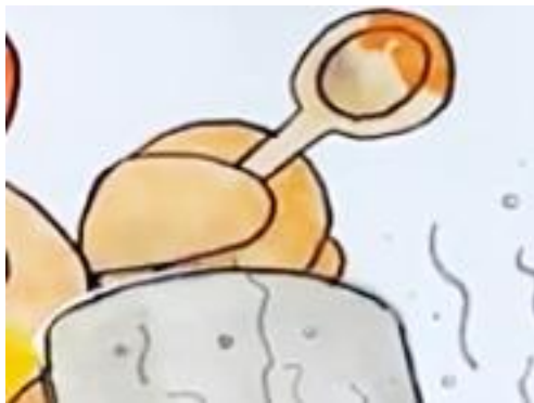
LA CUILLERE la cuillère la cuillère