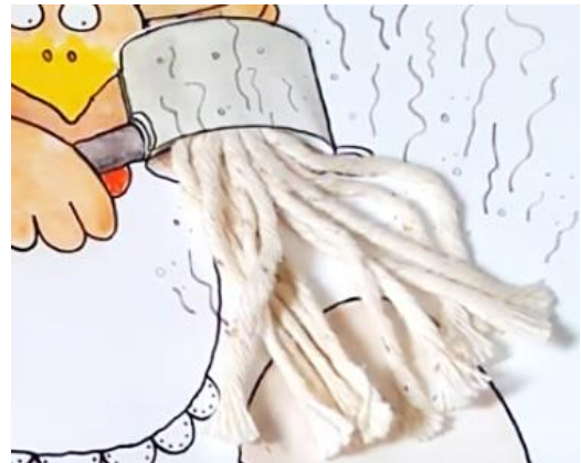
LES SPAGHETTIS les spaghettis les spaghettis