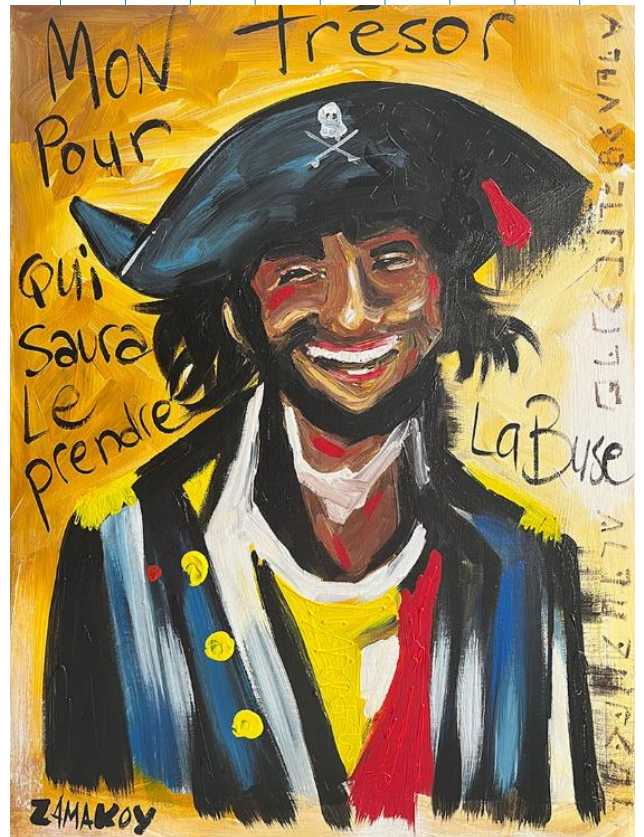
Zamakoy, Mon trésor pour qui saura le prendre , 2022, acrylique sur toile, 54 X 73 cm

c) Quelles sont les dernières paroles du pirate ?