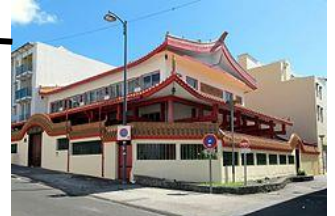
Temple Lisi Tong