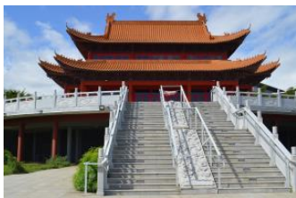
Temple Guan di