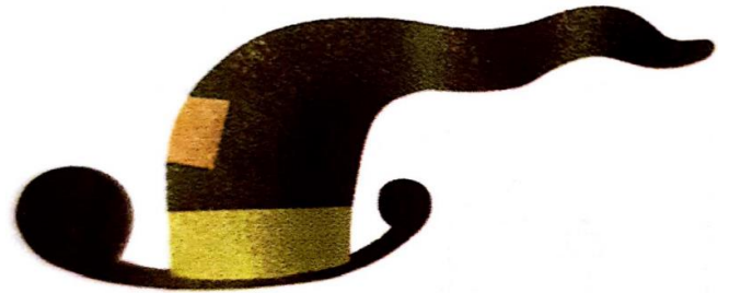
UN CHAPEAU un chapeau un chapeau