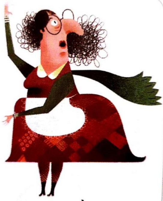
LA SORCIERE la sorcière la sorcière