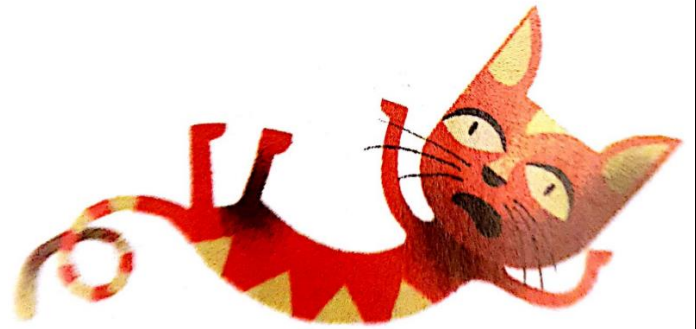
LE CHAT Le chat le chat