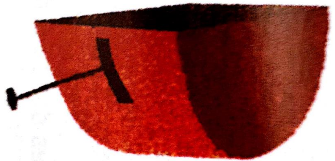
UN PANIER un panier un panier