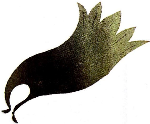
UNE CAPE une cape une cape