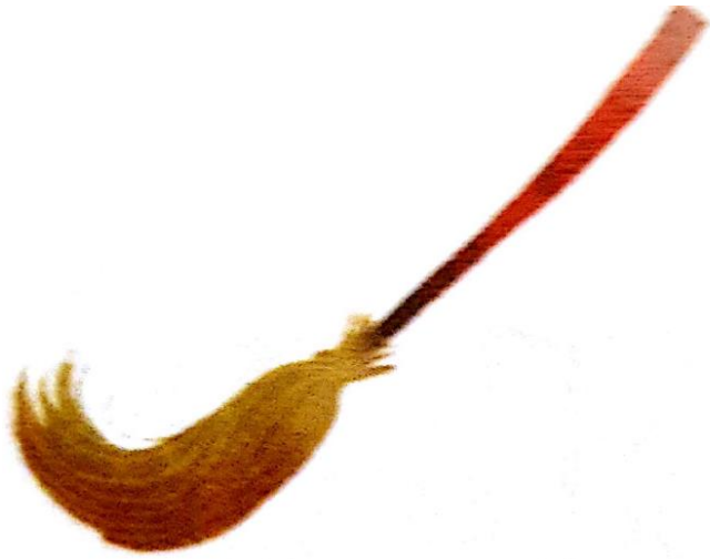
LE BALAI le balai le balai