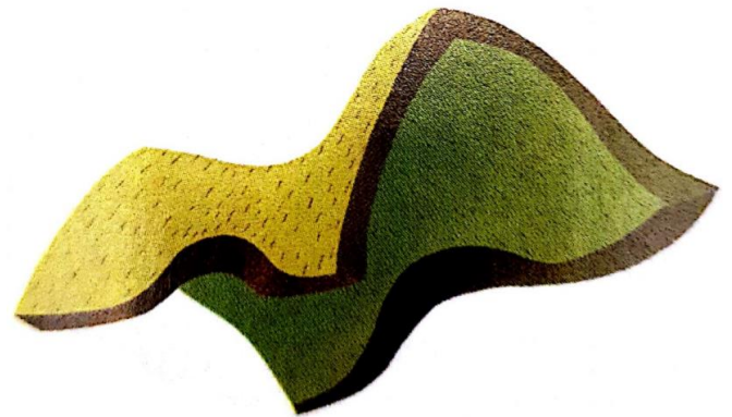
LE TOIT le toit le toit