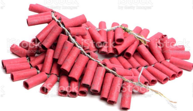
DES PÉTARDS des pétards des pétards