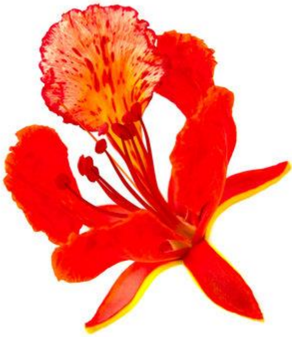
FLEUR DE FLAMBOYANT fleur de flamboyant fleur de flamboyant