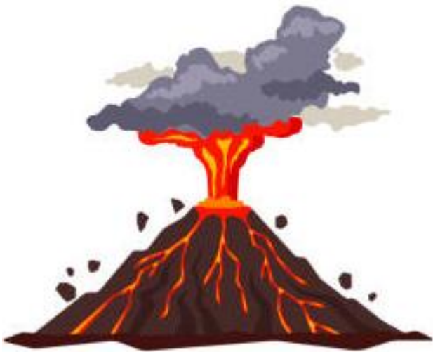
LE VOLCAN le volcan le volcan