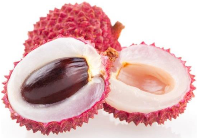
UN LETCHI un letchi un letchi