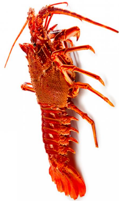
UNE LANGOUSTE une langouste une langouste