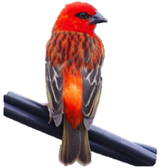
UN CARDINAL un cardinal un cardinal