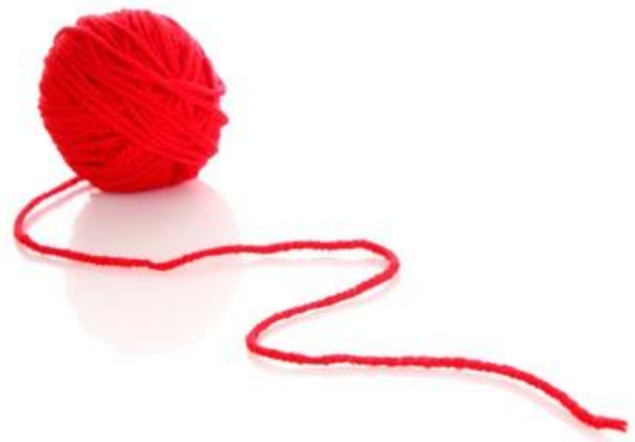
UN FIL ROUGE un fil rouge un fil rouge